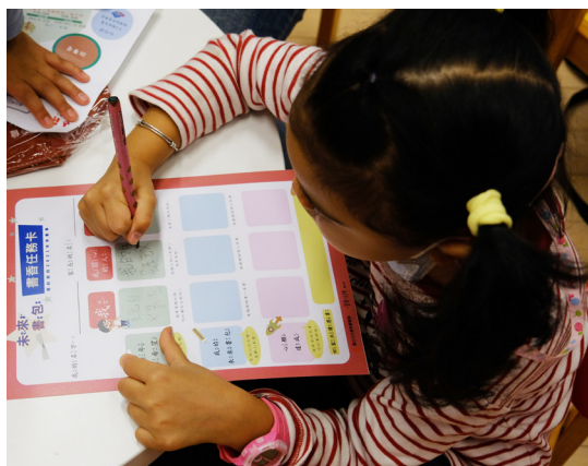
低年級的孩子專注地寫著自己的「新年新希望」