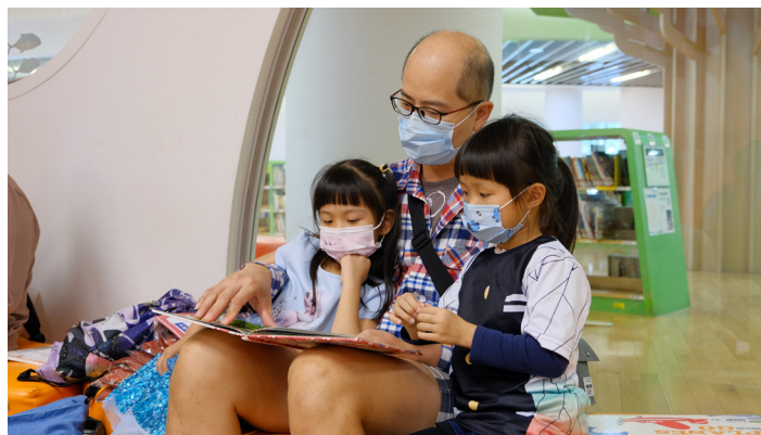
在圖書館也能親子共讀，「為愛朗讀」是最幸福的時光

沛慈老師也提到，運用線上「關鍵字」搜索系統，也是很方便的尋書方式，國資圖亦提供「兒童版網頁」，家長可以帶著兒童上網搜尋自己想借的書籍並獲得圖書館最新的親子活動消息，以不同的方式建立閱讀樂趣，讓孩子主動學習及查找資料。