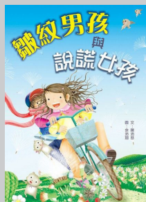
《皺紋男孩與說謊女孩》