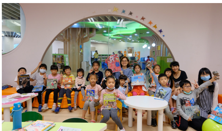
書香親子日，未來書包活動大合照