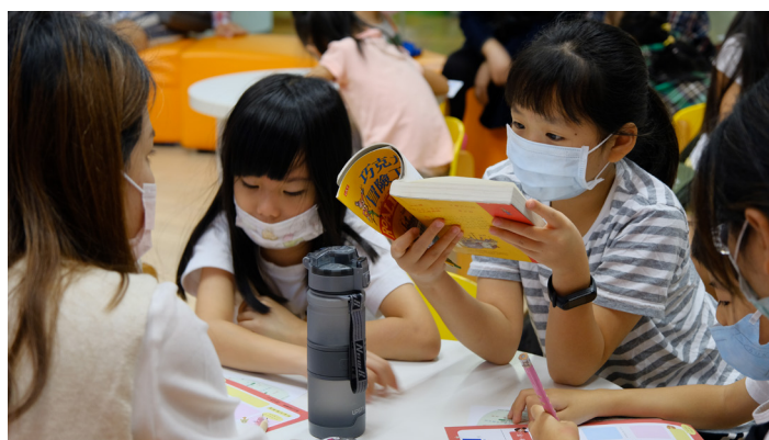
識字量增加後，有注音的橋樑書能夠讓兒童自主閱讀