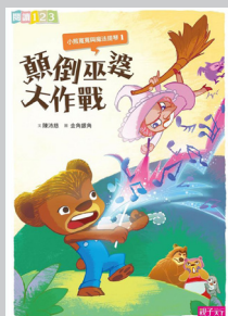
《小熊寬寬與魔法提琴 1： 顛倒巫婆大作戰》