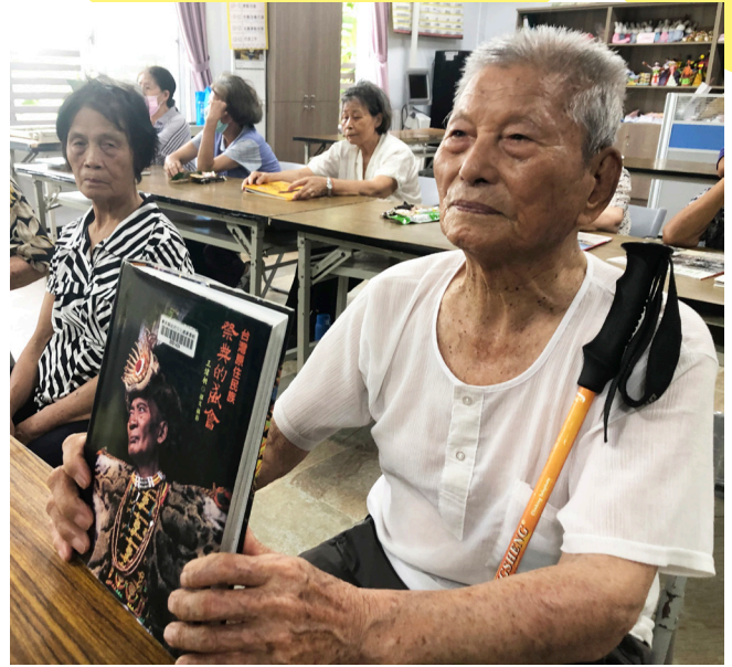
92歲蔡伯伯，用人生第一張借閱證借了這本書