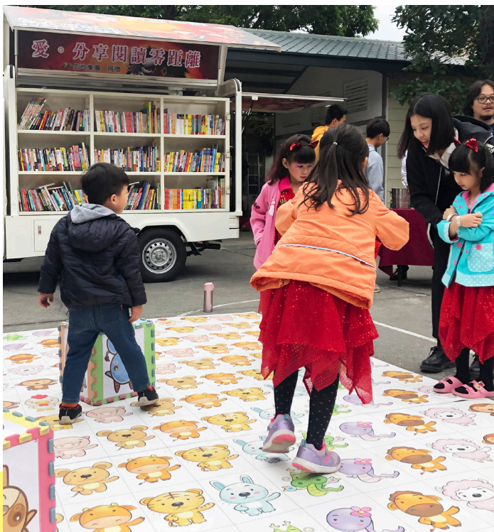
書車主題書展，結合周末派兒童活動