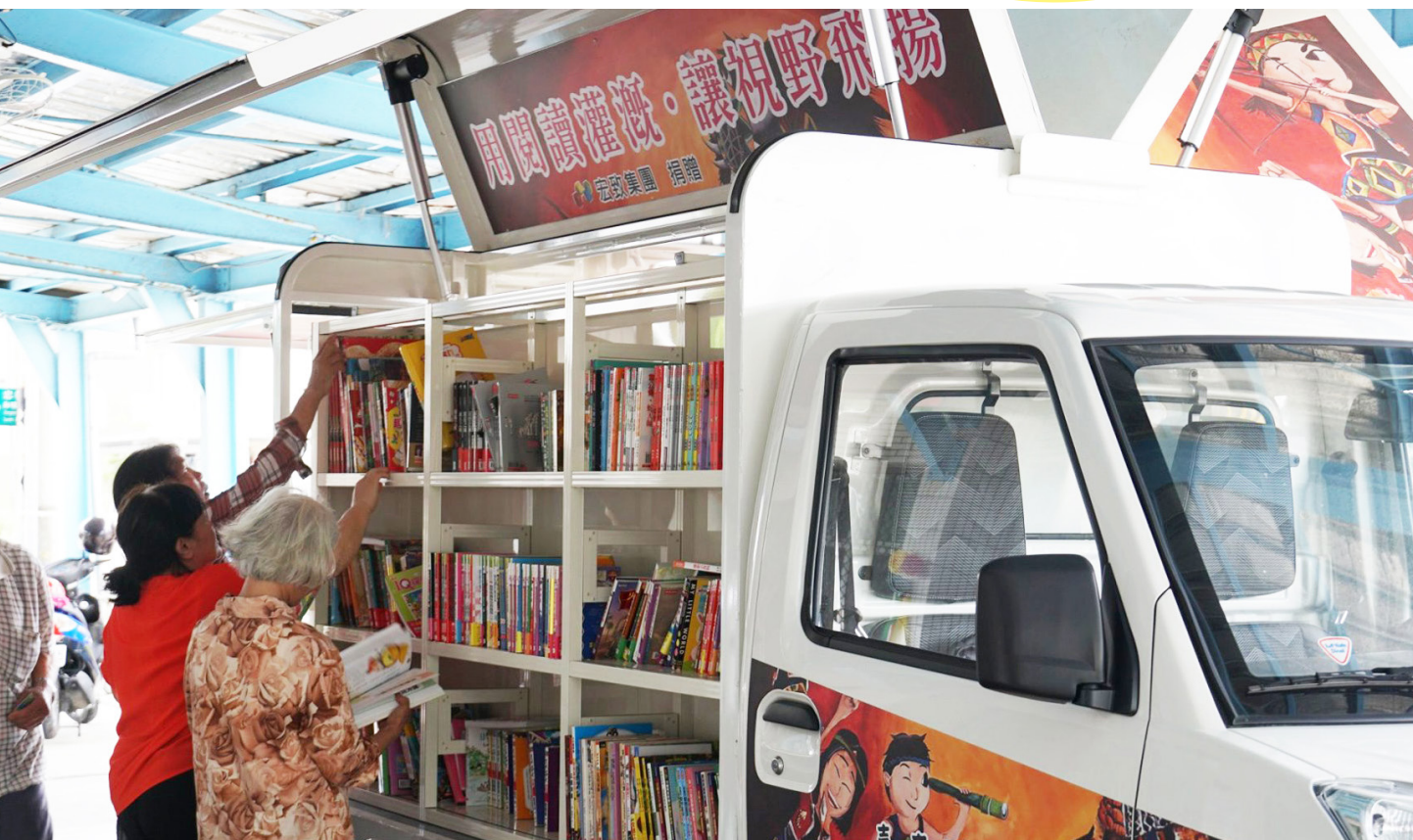
書車前往文化健康站，提供至長者找書、看書